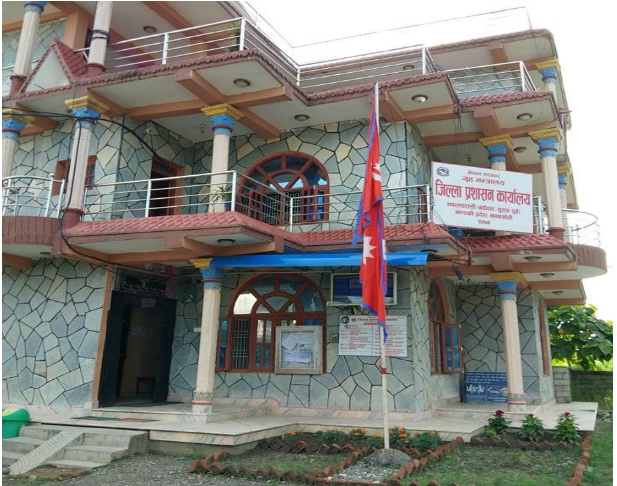
जिल्ला प्रशासन कार्यालय नवलपरासी (बर्दघाट-सुस्ता पूर्व)

नेपालको गण्डकी प्रदेश अन्तर्गत पर्ने ११ वटा जिल्ला मध्येको एक जिल्ला नवलपरासी (बर्दघाट सुस्ता पूर्व) हो । नेपालको संविधान (२०७२) मा साविकको नवलपरासी जिल्लालाई नवलपरासी (बर्दघाट सुस्ता पूर्व) र नवलपरासी (बर्दघाट सुस्ता पश्चिम) नामाकरण भै छुट्टा छुट्टै जिल्लाको रूपमा अनुसूचीमा उल्लेख भए बमोजिम मिति २०७४।०७।१९ गते देखि जिल्ला प्रशासन कार्यालय नवलपरासी (बर्दघाट सुस्ता पूर्व) को नामबाट कार्यालय संचालन भै आएको छ । मुख्यतया यस कार्यालयले नेपाल सरकार कार्यविभाजन नियमावली, २०७४ ले निर्दिष्ट गरेका गृह प्रशासनका सम्पूर्ण अधिकार क्षेत्र भित्र रहेर काम गर्दै आएको छ । जसमा संघ, प्रदेश र स्थानीय तहहरू बीच समन्वय र सुरक्षा प्रवन्ध, अपराध रोकथाम तथा नियन्त्रण, नागरिकता तथा राहदानी वितरण, हातहतियार तथा खरखजाना, सार्वजनिक सम्पत्तिको संरक्षण, जुवा जन्य क्रियाकलापको नियन्त्रण, लागूऔषध नियन्त्रण, विपद् व्यवस्थापन, सीमा सुरक्षा, अत्यावश्यक वस्तु तथा सेवाको आपूर्ति तथा बजार अनुगमन, सरकारी सवारी साधनको समुचित प्रयोगको व्यवस्था मिलाउने र अन्य आकस्मिक सम्पूर्ण कार्यहरू सम्पादन गर्दै आएको छ ।